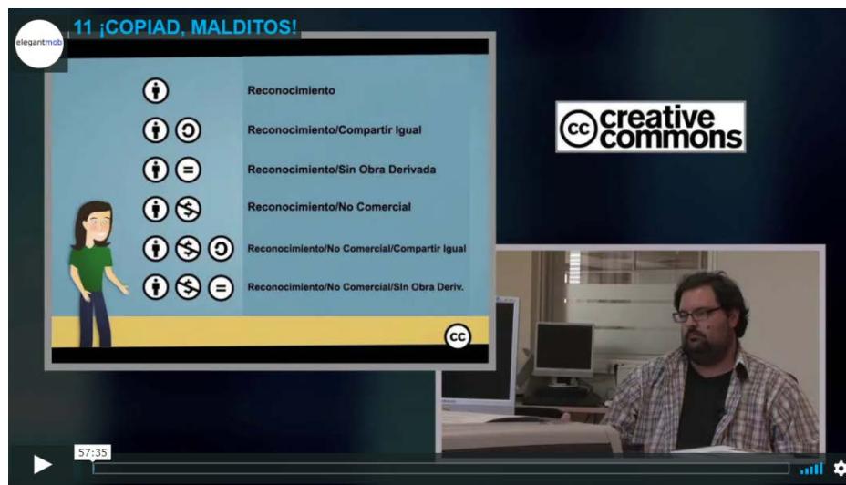
Imatge 4: Documental produït per tve sobre els reptes ètics de la propietat intel·lectual