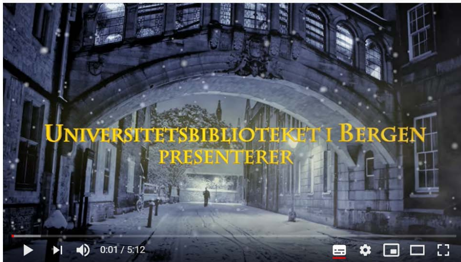
Imatge 5: Vídeo sobre plagi de la Universitat de Bergen