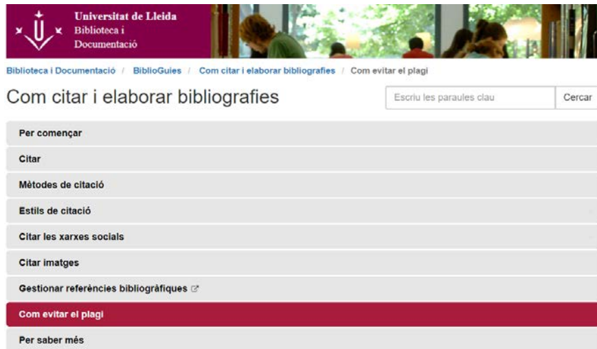
Imatge 1: Biblioguia de la Universitat de Lleida